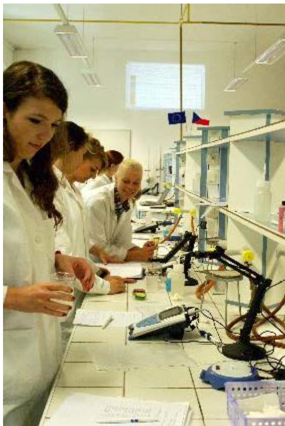
KA 1-2 Stanovení biologicky významných iontů