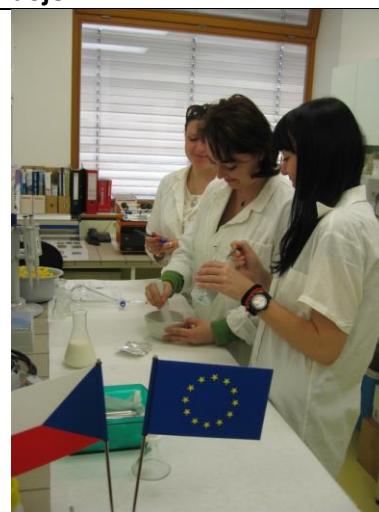
KA 1-2 Příprava vzorků pro extrakci za zvýšeného tlaku a teploty