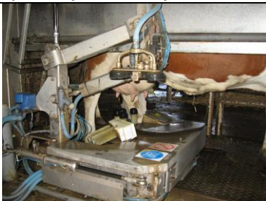
KA 4-4up Vytvoření multimediální učební pomůcky – výukový film „Robotizované dojení“