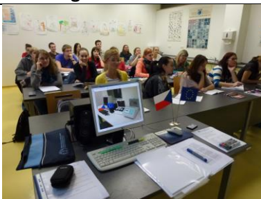
KA 1-7 Stanovení energetické spotřeby u vakuových balíček