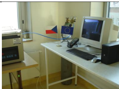
KA 1-7 Stanovení energetické spotřeby u vakuových balíček