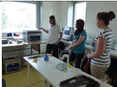
KA 3-1 Balení potravin