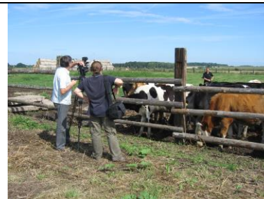
KA 4-4up Vytvoření multimediální učební pomůcky – výukový film „Robotizované dojení“