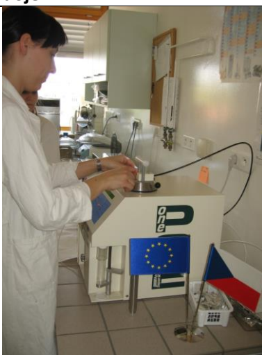
KA 1-2 Práce s extraktorem