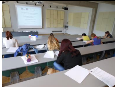
KA 4-9up Studenti 5. ročníku FVHE píší zápočtové testy