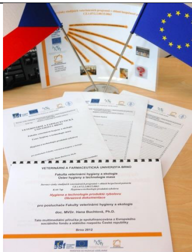
KA 4-7up Multimediální pomůcka