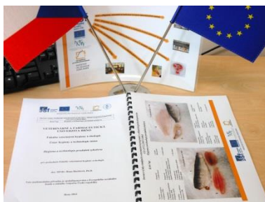
KA 4-7up Multimediální pomůcka