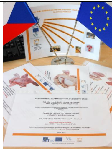
KA 4-8up Praktické návody pro výuku cvičení z Hygieny produkce masa Obrazová dokumentace patologicko – anatomických nálezů u kuřecích brojlerů, technologie porážení