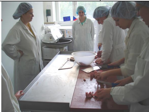
KA 4-10up Zpracování drůbežního odděleného masa do masného výrobku