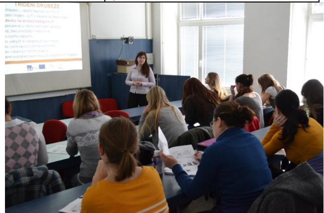
KA 4-10up Práce studentů s tištěnými prezentacemi na přednáškách