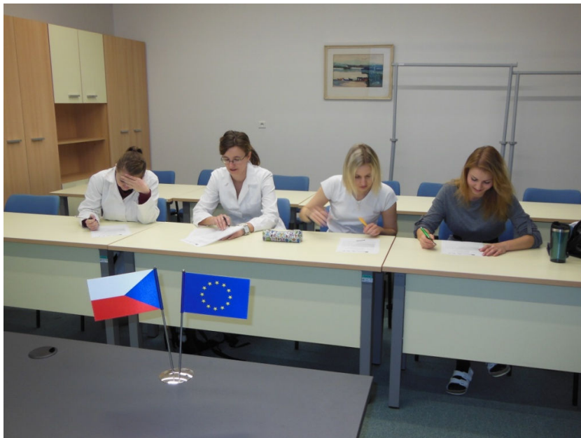
Obr. 1: Vyhodnocování dotazníků