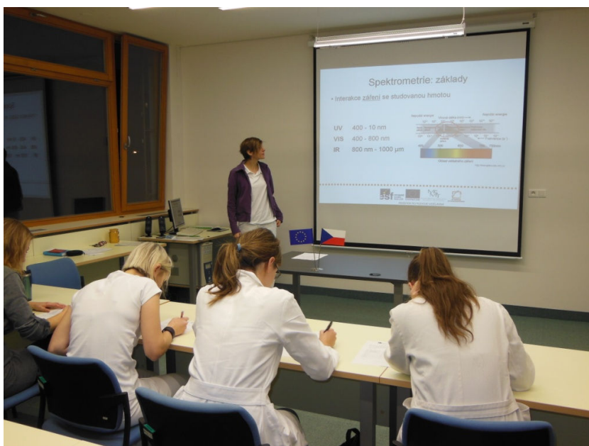
Obr. 4: Seznámení studentů s principy metod formou PowerPointové prezentace