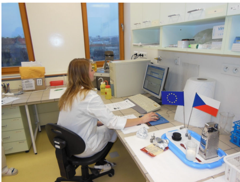
Obr. 3: Práce s přístroji (FT-NIR spektrometrie)