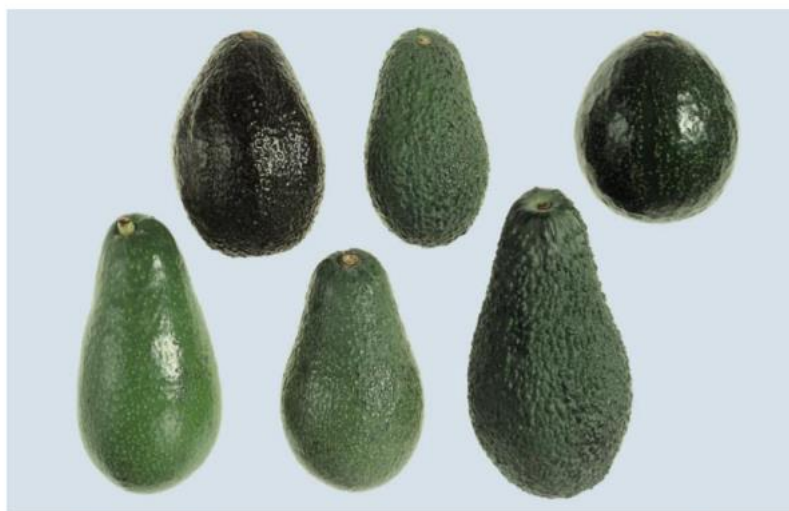
photo 1 : Examples of varieties (cultivars) - Top : Benik, Hass, Nabal - Bottom : Ettinger, Fuerte, Pinkerton Exemples de variétés (cultivars) - En haut : Benik, Hass, Nabal - En bas : Ettinger, Fuerte, Pinkerton Ejemplo de variedades (cultivares) - Arriba : Benik, Hass, Nabal - Abajo : Ettinger, Fuerte, Pinkerton

Normalisation internationale des fruits et légumes : Avocats