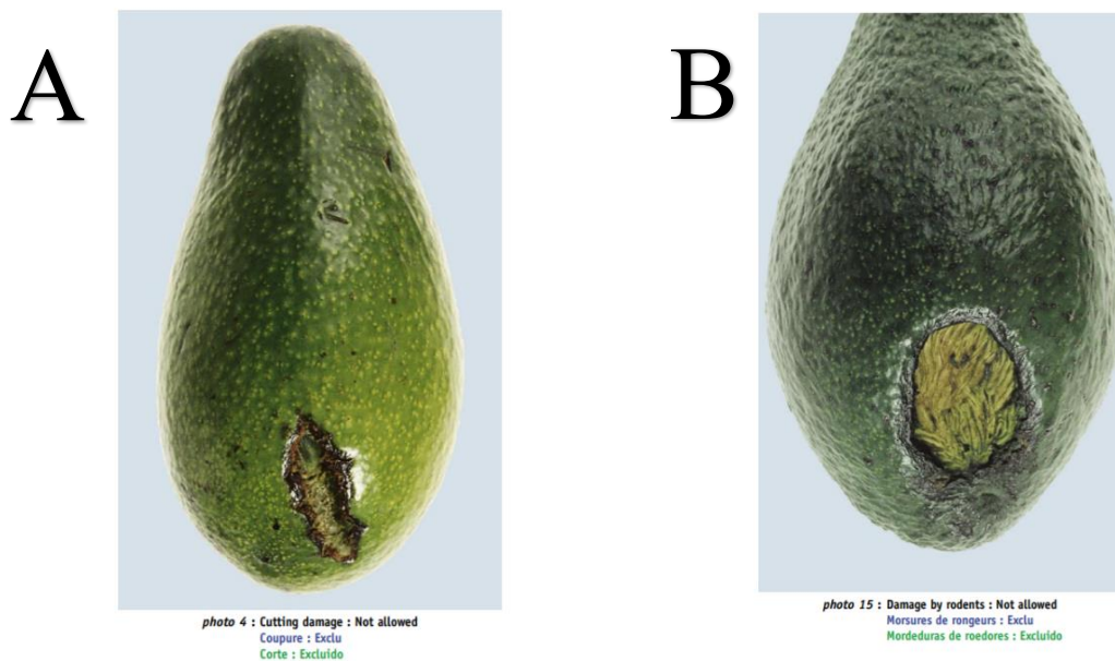
Obrázek č. 2: fotodokumentace z OECD příručky provádějící normu EHK/OSN pro avokáda: (A) plod je poškozený řezem a nemůže být považován za intaktní, (B) plod je poškozený škůdci