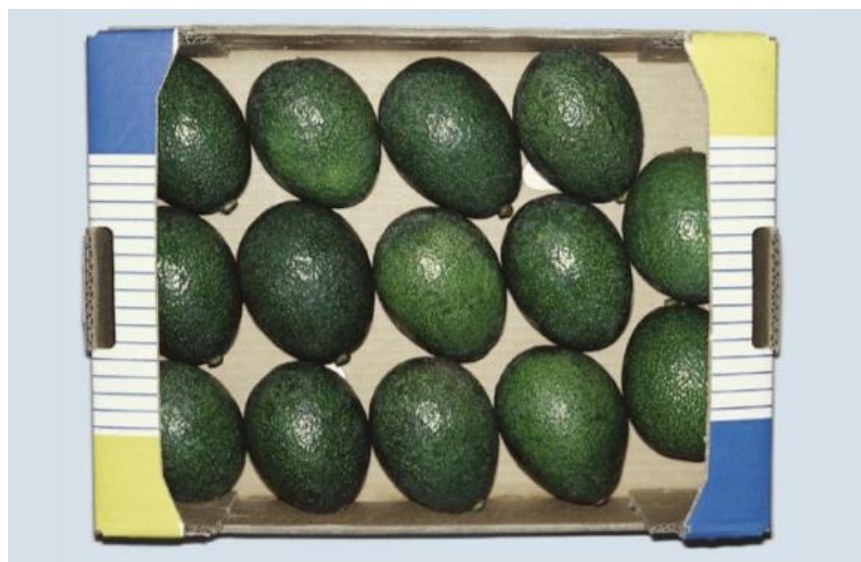
photo 37 : Very careful presentation : "Extra" Class Présentation très soignée : Catégorie "Extra" Presentación muy cuidada : Categoría "Extra"