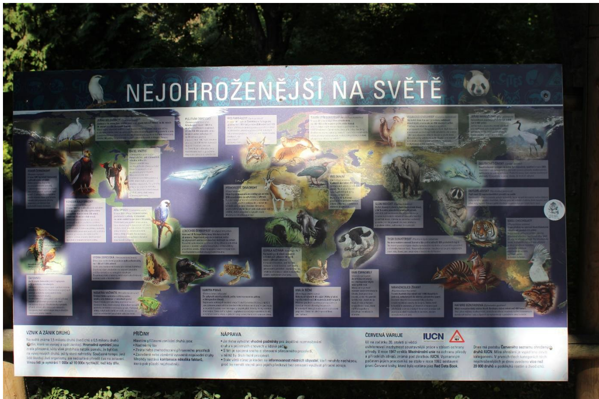
Informační tabule často zobrazují problematiku ohrožených druhů zvířat, případně faktorů vedoucích k jejich ohrožení, včetně antropogenní činnosti.