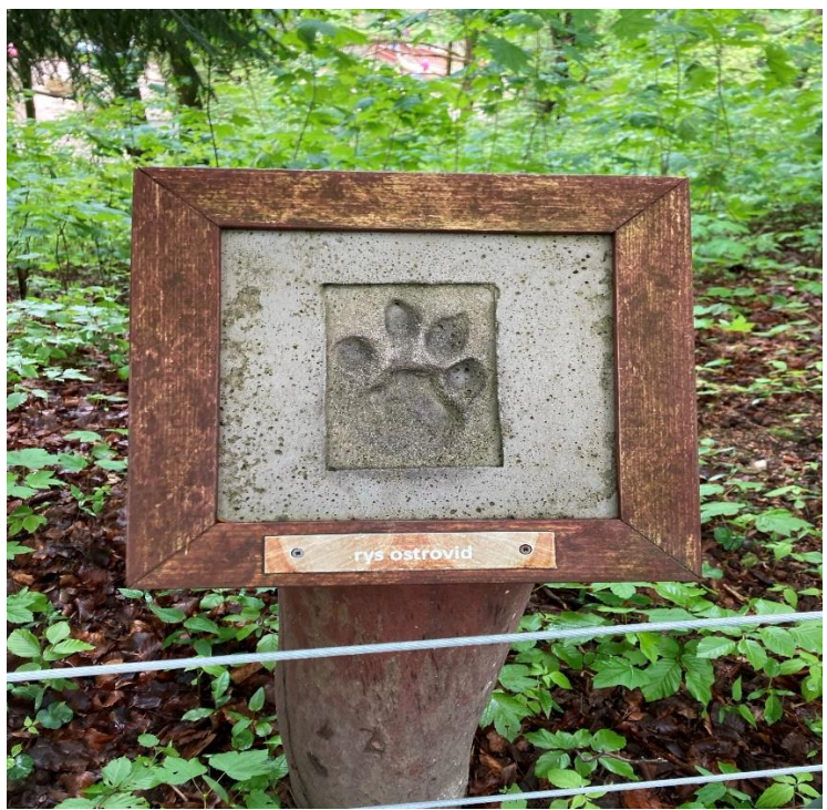
Zdánlivě obyčejné zobrazení stopy může zvýšit zájem o volně žijící druhy živočichů nejen ve světě, ale i o druhy běžně žijící na území České republiky.